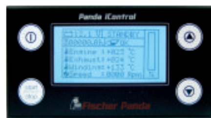
Panda iControl digitális kijelző