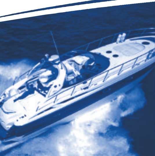
A hajó fő rendszere